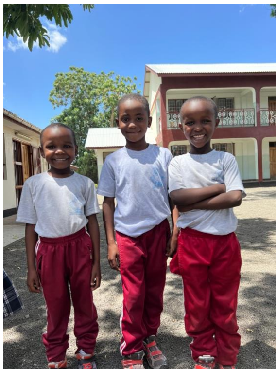
Billeder fra skolen