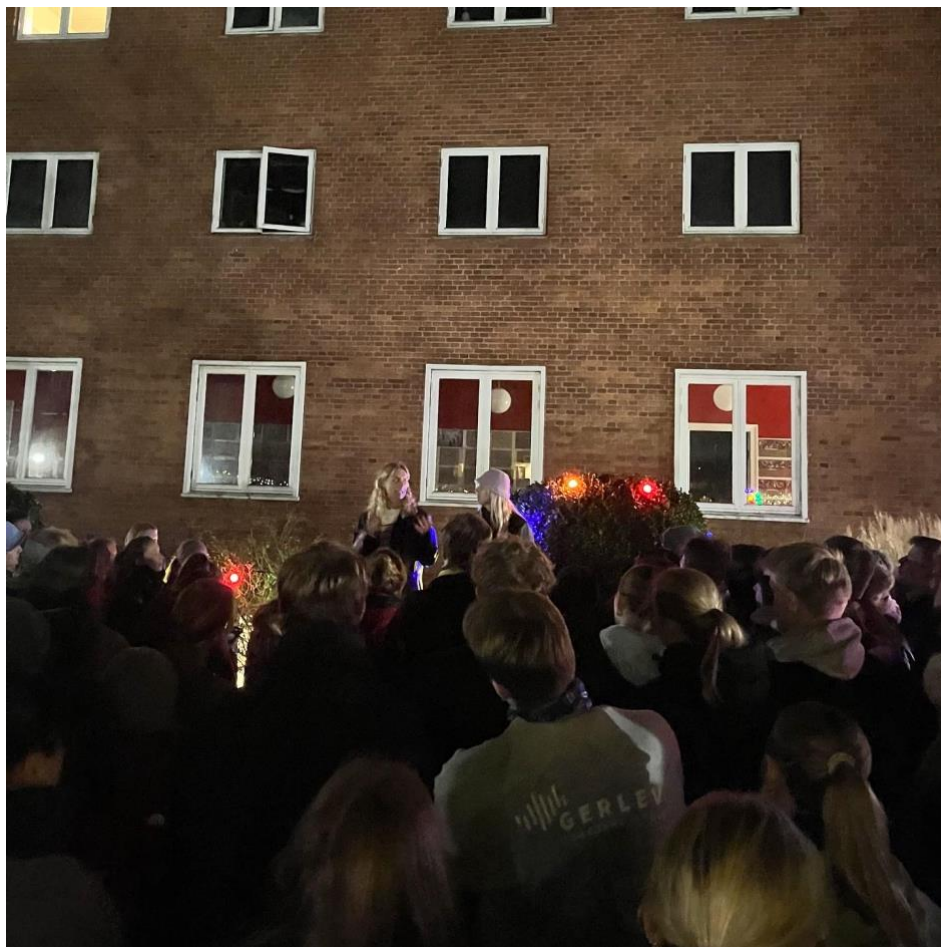
Åbningstalen på Gerlev Idrætshøjskole