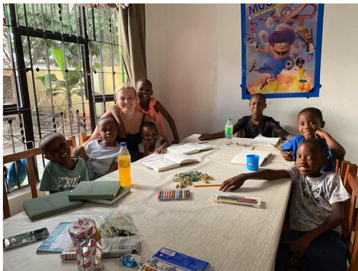
Lilli fra frivillig i 2 måneder