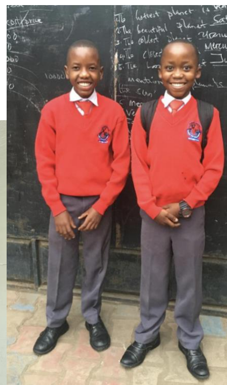
Billede fra skolen "Tumaini mission trust"